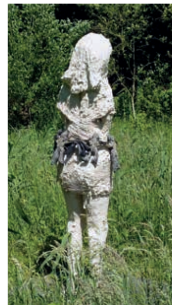
Snow White nr 7