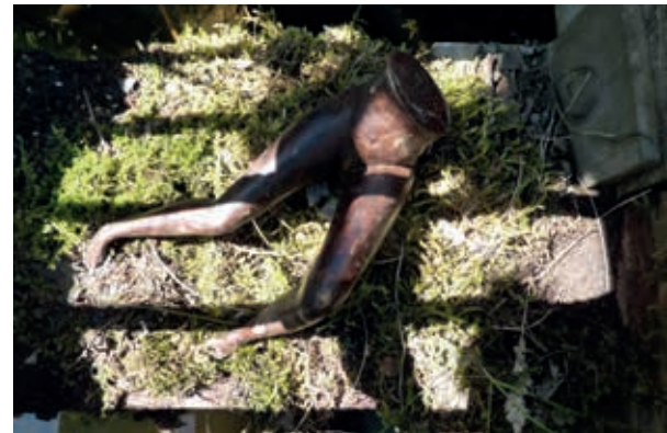
Soil of Ardour

'Deze twee aardmannen heb ik speciaal voor deze expositie gemaakt. De Heemtuin bestaat eigenlijk bij de gratie van de verschillende soorten aarde. Je zou ze de bewakers van deze unieke plek kunnen noemen.'