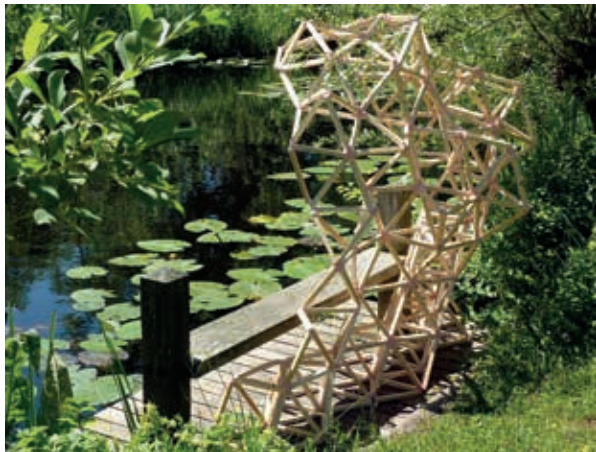
The Crystal Series

'Het groeiproces van een bevruchte eicel is fascinerend. Meestal gaan we hier aan voorbij omdat het moeilijk zichtbaar is. Door dit zo enorm uit te vergroten wordt het proces manifest. De "Eicel" die hier getoond wordt, past perfect bij het thema metamorfose en op de locatie van een appelboomgaard krijgt dit werk nog een extra lading.'