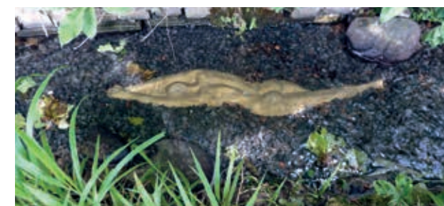
Shallow water poetry