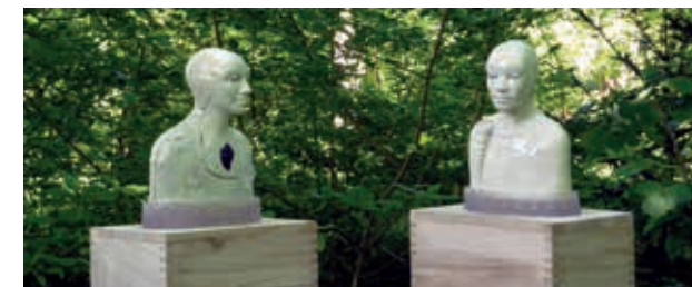
Myrrh and Frankincense en Cluster of Camphire